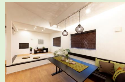
大きなテーブルと造り付けベンチ