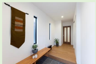
座って靴を脱ぎ履きできて便利