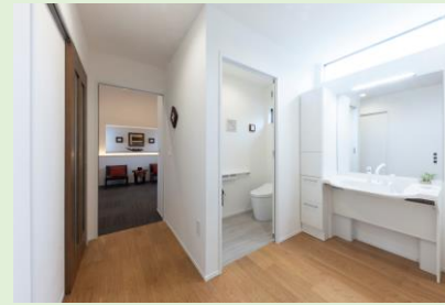
使いやすい車いす対応の洗面