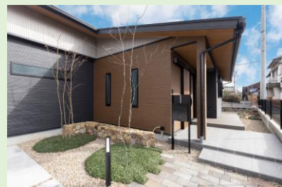
穏やかな佇まい。石と緑のバランス