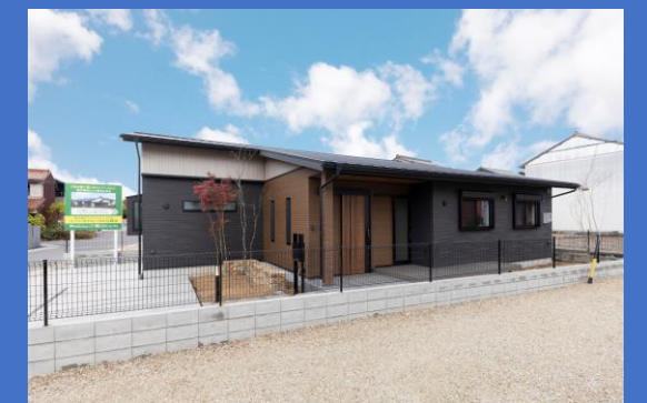
敷地面積：211.74 m 2 (64 坪) 延床面積：93.30 m 2 (28.22 坪)