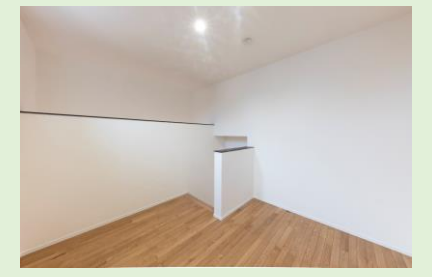
趣味の部屋・書斎・唯一の客間