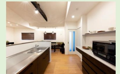
通路がゆったりキッチンの