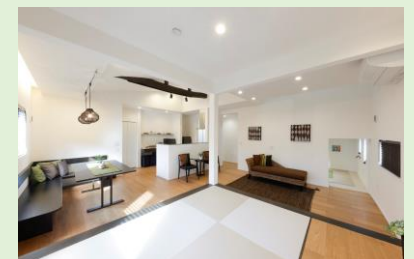
リビングとダイニングと目線が同じ