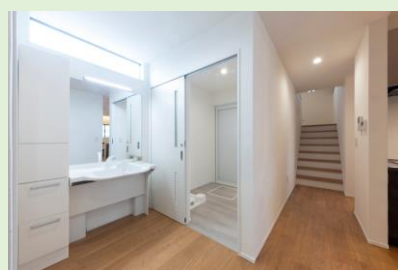
寒くない、広い、シンプルな通路